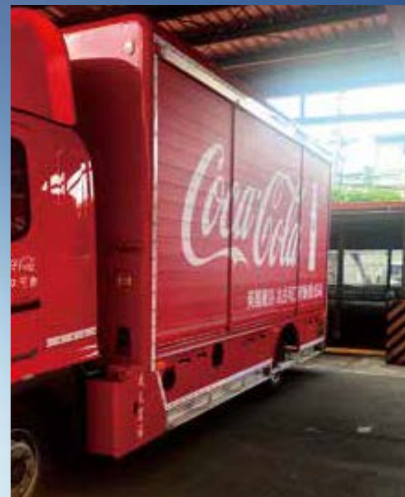
賣場冰箱造型陳列